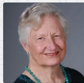
Dr. Carole Oglesby

EX PROFESORA DE LA UNIVERSIDAD DE TEMPLE, LÍDER MUNDIAL RECONOCIDA ESPECIALIZADA EN EL ESTUDIO DE MUJERES Y GÉNERO EN EL DEPORTE, Y LA PSICOLOGÍA DEL DEPORTE. EX PRESIDENTE DE LA NATIONAL ASSOCIATION OF GIRLS AND WOMEN'S SPORT Y DE LA WOMEN SPORT INTERNATIONAL.