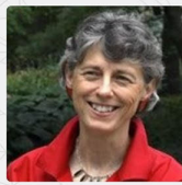
Dra. Deborah Feltz

EX PROFESORA DE LA UNIVERSIDAD DE TEMPLE, LÍDER MUNDIAL RECONOCIDA ESPECIALIZADA EN EL ESTUDIO DE MUJERES Y GÉNERO EN EL DEPORTE, Y LA PSICOLOGÍA DEL DEPORTE. EX PRESIDENTE DE LA NATIONAL ASSOCIATION OF GIRLS AND WOMEN'S SPORT Y DE LA WOMEN SPORT INTERNATIONAL.